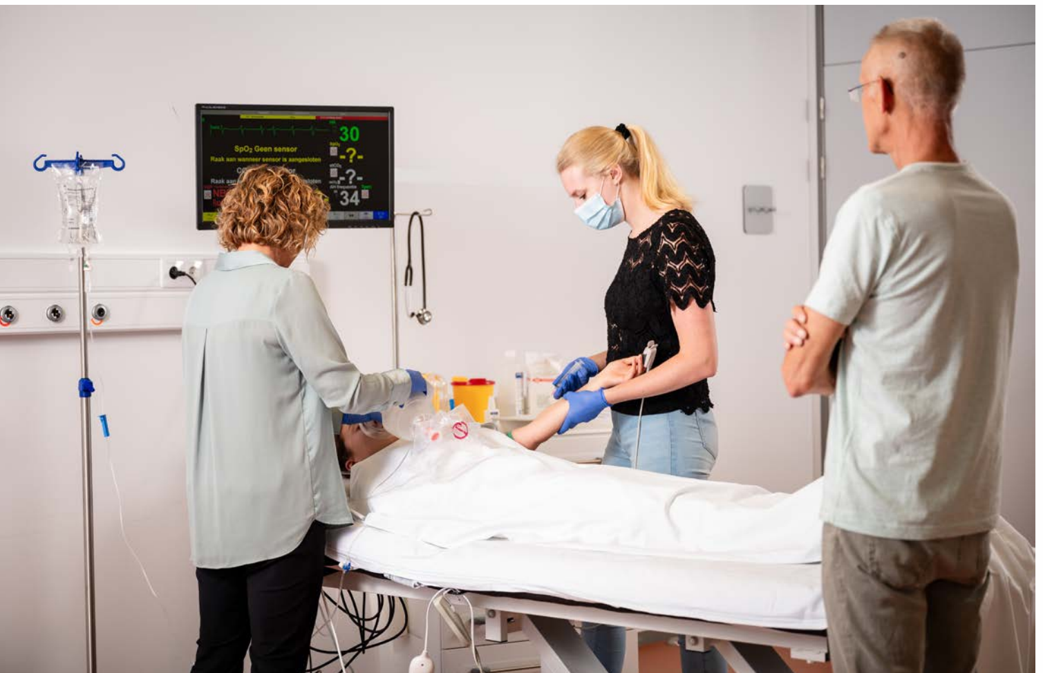
Aios donorgeneeskunde.

Het blijft urgent om het aanhoudende tekort aan artsen binnen de sociale geneeskunde en eerste lijn aan te pakken. De tekorten blijven toenemen en zullen niet op korte termijn zijn opgelost. Dit project heeft een positieve ontwikkeling in gang gezet waarbij het extramurale geneeskundige domein is versterkt en onderlinge samenwerking is bevorderd. Deze verbinding draagt bij aan het gezamenlijk en integraal aanpakken van de tekorten aan extramuraal werkzame geneeskundigen.