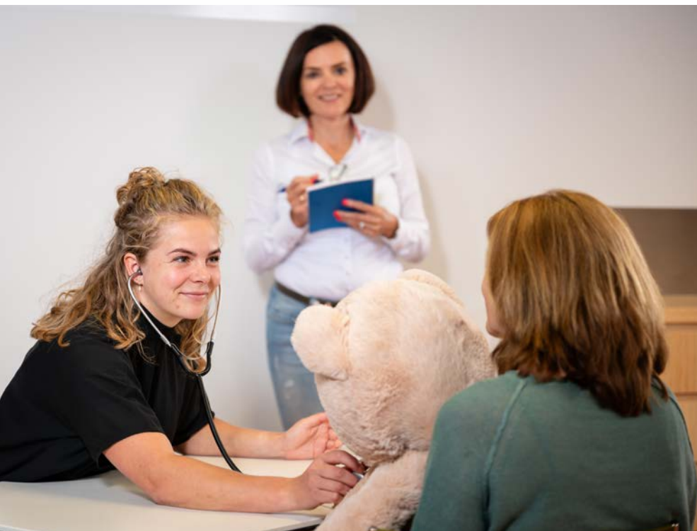
Aios geneeskunde voor verstandelijk gehandicapten