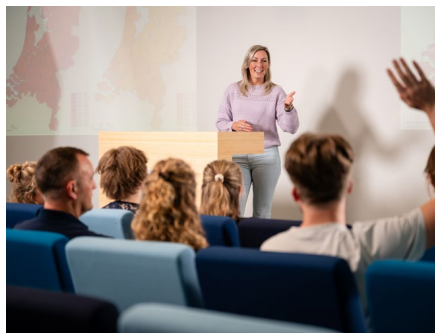
arts Maatschappij + Gezondheid