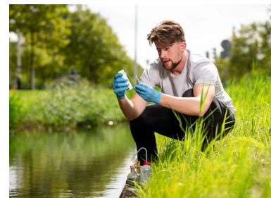
arts medische milieukunde