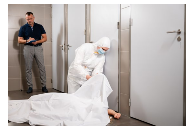
arts forensische geneeskunde